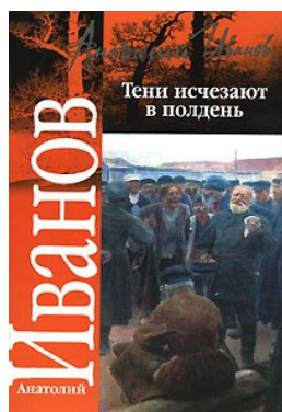
«Тени исчезают в полдень» 1971 г.

В разное время были экранизированы многие произведения Анатолия Иванова.