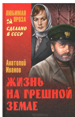
«Жизнь на грешной земле» 1976 г.