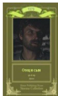
«Отец и сын» 1979 г.