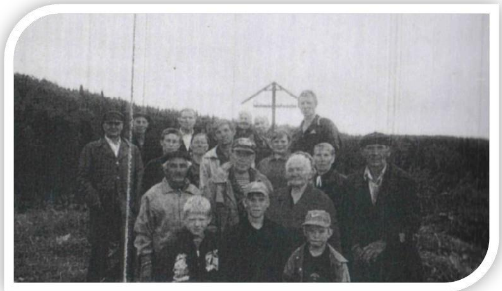
Памятный знак деревне Осинина