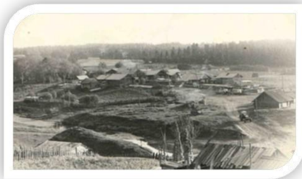
Деревня Заречка, 70-е годы XX века

Деревня составляет часть села Верх-Язьва и отделяется от него рекой Шудьей, впадающей в реку Язьву. В настоящее время нет административного деления на Верх-Язьву и Заречку. В Заречке располагается Верх-Язьвинская участковая больница, молебный дом, магазин ООО «Верх-Язьвинский коопторг», жилые дома.