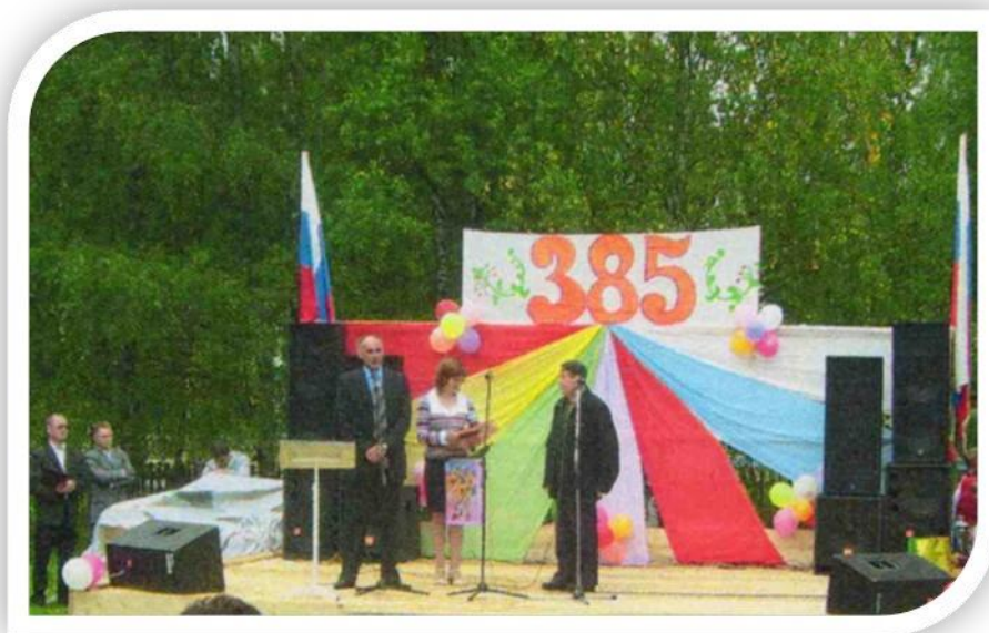
Праздник День села Верх-Язьвы, 2009 год

В 2003 году образовалось Верх-Язьвинское сельское поселение с административным центром в селе Верх-Язьва. С 2008 года, с закрытием сельскохозяйственного производства на территории села Верх-Язьва, существуют личные крестьянско-фермерские хозяйства и индивидуальные предприниматели. Строится новое здание ВерхЯзьвинской школы, благоустраиваются дороги и улицы, дома жителей украшают цветники. Продолжают функционировать участковая больница, почта, культурно-досуговый центр, сельская библиотека, развивается малый бизнес: сеть магазинов, в т.ч. ООО «Верх-Язьвинский коопторг», пилорамы.