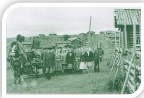
Деревня Ванино, 1950 год

Официальный год закрытия деревни 2009 год.