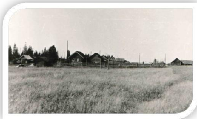
Деревня Гурина, год неизвестен