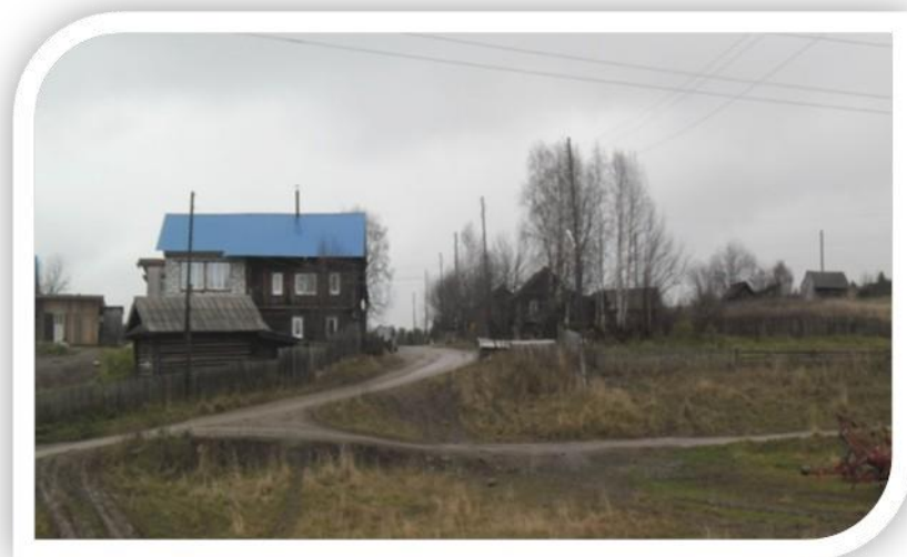
Деревня Горца, 2015 год

Деревня располагалась в местности при впадении реки Шудьи в реку Язьва. Селение слилось с селом Верх-Язьва. На месте Горцы теперь расположен жилой микрорайон под названием «Япония».