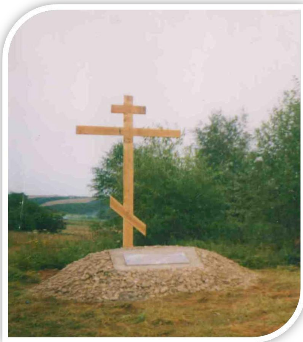
Памятный знак деревне Шереметьева -18-

Наш электронный адрес: vankova.80@list.ru