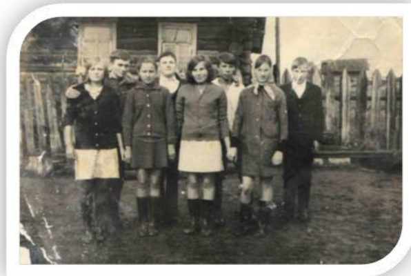
Жители деревни Желубаева, год неизвестен

В 1983 году деревня была признана неперспективной, жителей расселили. На территории деревни теперь огороды и сенокосы.