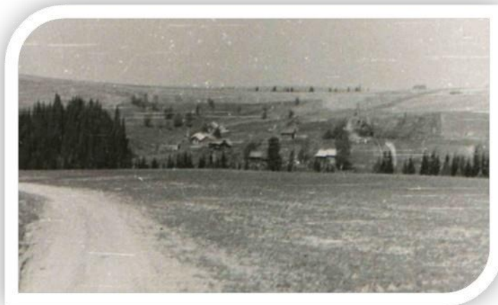
Деревня Титкова, 50-е годы XX века