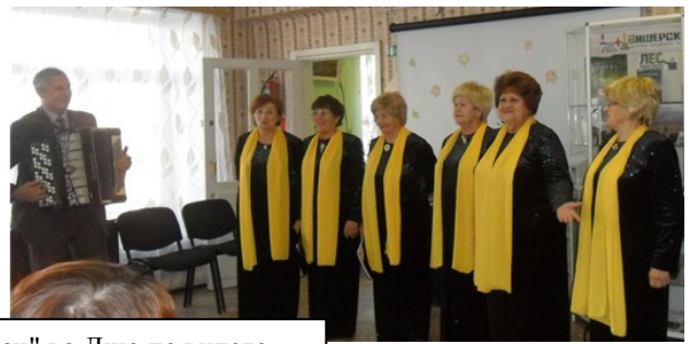
"Праздник добрых сердец" ко Дню пожилого человека в библиотеке проводят традиционно для всех работников культуры района.

Отработан в библиотеке проект «Смена ветра внутри страны».