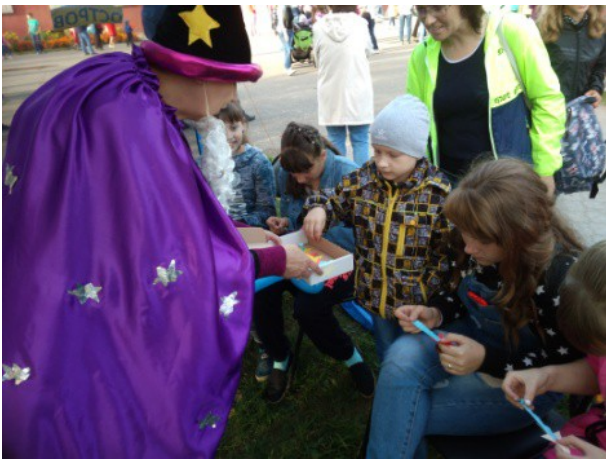
Единый день чтения "Золотые острова", ЦДБ