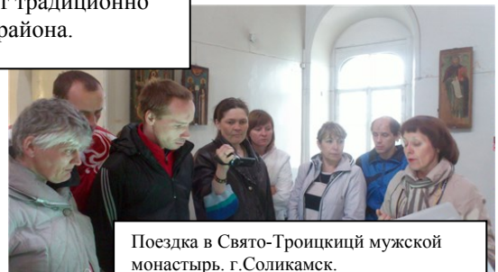
Поездка в Свято-Троицкий мужской монастырь. г.Соликамск.

Очистили территорию бывшего Морчанского кладбища от мусора возле Памятного знака жертвам политических репрессий, посетили музей памяти жертв политических репрессий, по местам ссылки В. Т. Шаламова, в т.ч. г.Соликамске, выступили на краевой НПК с темой «Поверх барьеров»: переписка В. Шаламова с Б. Пастернаком".