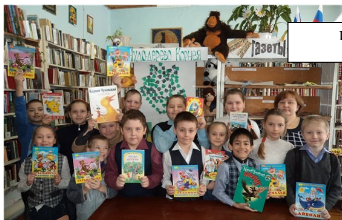
Игра - путешествие "Страна Чуккокола" (библиотека № 18)