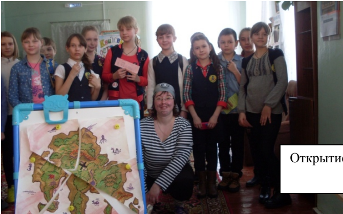
Открытие недели детской книги в ЦДБ