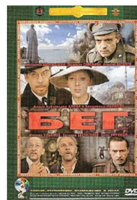
«Бег» 1970 г.