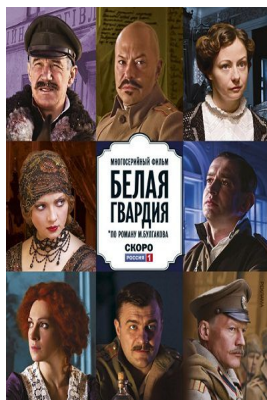
«Белая гвардия» последняя экранизация 2012 г.