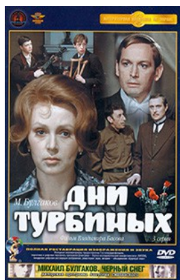
«Дни Турбиных» 1976 г.