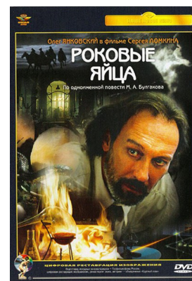
«Роковые яйца» 1995 г.

Предлагаем читателям окунуться в фантастический мир произведений М. А. Булгакова!