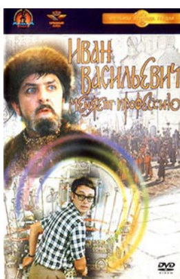
«Иван Васильевич Меняет профессию» 1973 г.

В разное время были экранизированы многие произведения М. А. Булгакова.