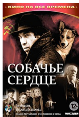
«Собачье сердце» 1988 г.