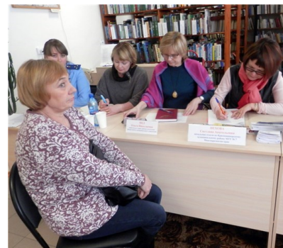
В Центральной библиотеке приём граждан ведут специалисты МТУ № 7

В обязанности управления входит : • предоставление мер социальной поддержки (назначение пособий и льгот, бесплатные услуги) людям оказавшимся в трудной жизненной ситуации, пенсионерам, инвалидам, многодетным семьям, участникам Великой Отечественной войны, людям имеющим большой трудовой стаж;